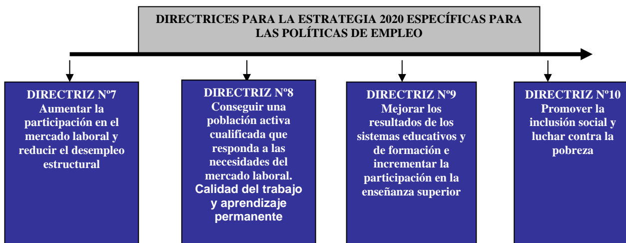
Gráfico 1.- Directrices de la Estrategia 2020 relativas a la política de empleo

Una visión más detallada, a los efectos de considerar cada una de estas Directrices en el proceso de formulación de las Directrices estratégicas para el País Vasco, permite establecer los siguientes principios y criterios de actuación: