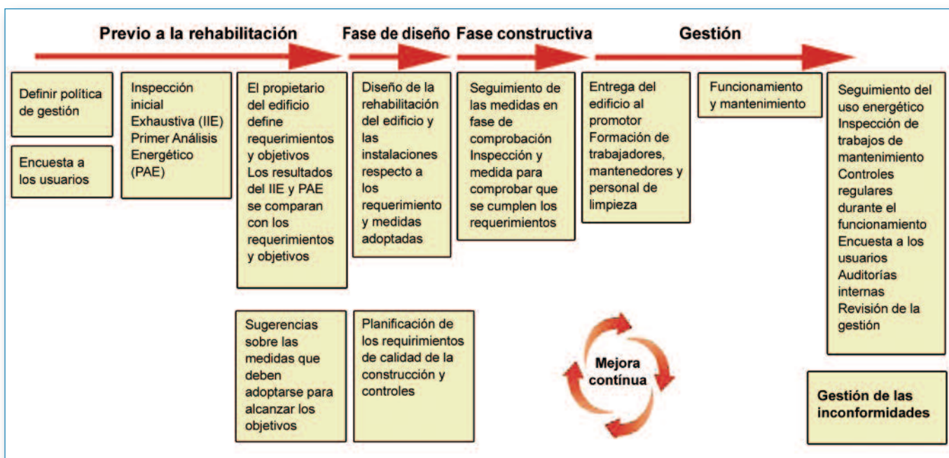
Figura 2: Pasos a seguir en cada fase del Sistema de Garantía

Encontrar un proyecto de rehabilitación que asumiera incorporar