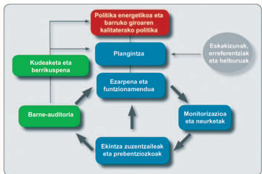
1. irudia: barruko giroaren kalitatea eta kalitate energetikoa bermatzeko sistemaren eredu

SQUARE proiektua EBko Intelligent Energy Europe programaren esparruan garatzen den proiektu bat da (1007-2010) eta sei herrialdetako